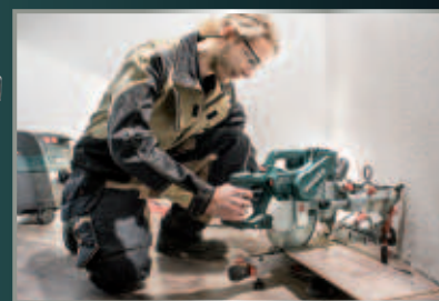
KGSV 72 Xact SYM

Extrêmement compacte grâce aux barres de traction intérieures : pas besoin d'espace derrière la scie