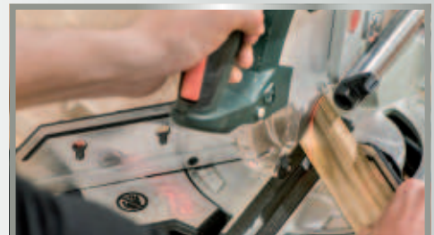
Laser à double ligne pour l'indication précise de la ligne de coupe à gauche et à droite de la lame de scie