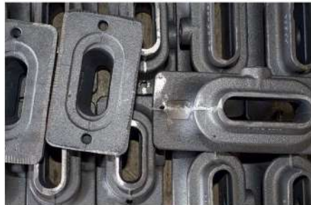
Ebavurage de pièces manufacturées