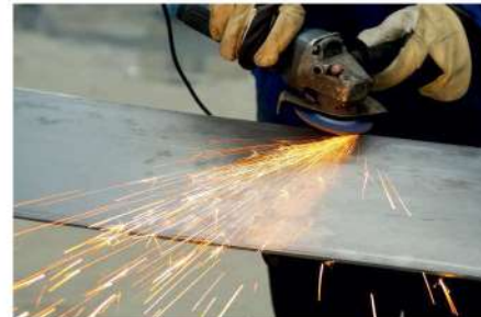
Chanfreinage de tôles