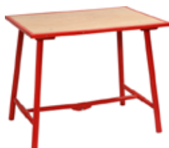
Table de monte