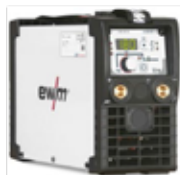
Pico 180 puls