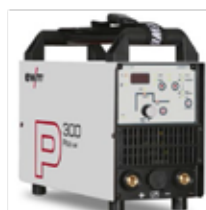
Pico 300 cel