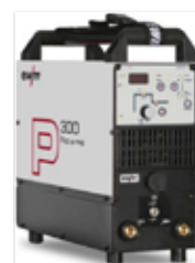
Pico 300 cel pws