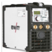
Pico 220 cel puls